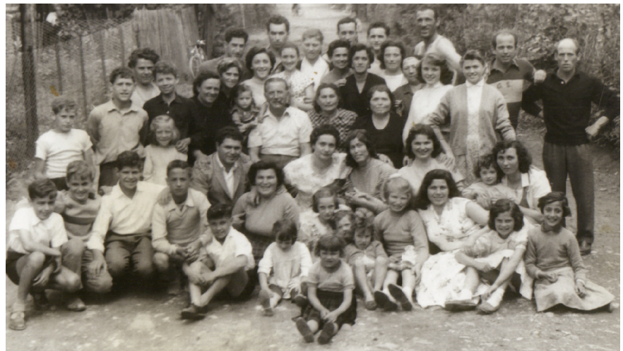
Il gruppo familiare Ballin (Marghera 1960): è evidente l'alto numero di bambini.

Tutto questo non succede per caso. La conquista dei "diritti civili", cioè la possibilità di divorzio (1974) e di interruzione volontaria della gravidanza