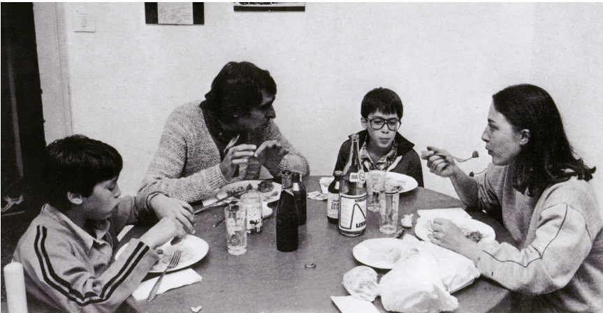
Il classico nucleo familiare a 4 componenti (Mestre 1970): la sua percentuale (20%) resta invariata nel tempo tra le famiglie con prole.

coppia è isolata, meno solidali i rapporti con le famiglie di origine e con le famiglie coetanee, ogni coppia vive in uno spazio chiuso, anche un solo figlio è di ostacolo alle attività produttive di mamma e papà, il costo di un bambino è troppo elevato per pensare di farne altri.