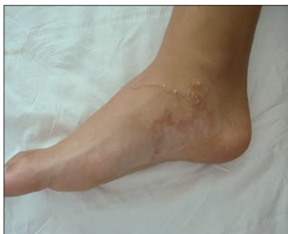
Figura 7. La larva cutanea migrans si localizza alle sedi che possono venire a contatto con il terreno: piedi (regione plantare, laterale e dorso del piede esposto quando si rimane sdraiati a prendere il sole a pancia in giù), glutei.