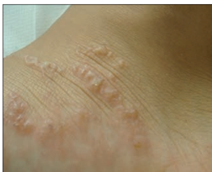
Figura 9. In fase iniziale può prevalere un aspetto papulare e le lesioni da grattamento possono confondere le idee. Nei casi di iniziale mancata diagnosi, tuttavia, l'aspetto caratteristico figurato e a zig zag che si evidenzia in pochi giorni elimina rapidamente tutti i dubbi di diagnosi differenziale.