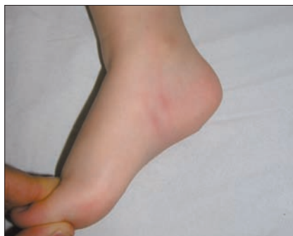
Figura 4. Le punture d'insetto possono tipicamente presentarsi con disposizione "colazione-pranzo-cena", cioè ripetersi linearmente dando l'impressione di una lesione elementare lineare pruriginosa o, come nell'immagine presentata, possono occasionalmente sovrainfettarsi e dare una stria linfangitica eritematosa. A differenza del quadro presentato da Agata, non evidenziano mai un andamento a zig zag.

Figura 3. Il dorso del piede può essere interessato anche dal lichen striatus (LS) (nell'immagine già nella sua fase di ipopigmentazione post-infiammatoria). Il LS è benigno e autorisolutivo, come il granuloma anulare, in tempi medio-lunghi (orientativamente un paio di anni). La terapia con cortisone topico è a volte in grado di accelerare i tempi di risoluzione, ma solo se applicata nella fase iniziale, caratterizzata da papule in fila indiana disposte lungo le linee di Blaschko. Anche il LS, a differenza del quadro presentato da Agata, è asintomatico.