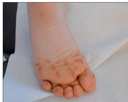
Figura 5. Le vescicole della "variante" evidenziate negli ultimi due anni della malattia mano-piede-bocca (MPB) (caratterizzata da onicomadesi a distanza) risultano più allungate e grandi (e quindi apparentemente "lineari") della variante "comune" di questa coxsackiosi, caratterizzata da vescicole di 1-3 mm di lunghezza. Più che pruriginose le vescicole della MPB sono riferite essere dolorose, soprattutto quando vengono colpiti bambini più grandi o adulti.

Figura 4. Le punture d'insetto possono tipicamente presentarsi con disposizione "colazione-pranzo-cena", cioè ripetersi linearmente dando l'impressione di una lesione elementare lineare pruriginosa o, come nell'immagine presentata, possono occasionalmente sovrainfettarsi e dare una stria linfangitica eritematosa. A differenza del quadro presentato da Agata, non evidenziano mai un andamento a zig zag.