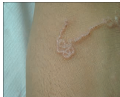
Figura 8. L'andamento a zig zag o figurato è tipico e praticamente esclusivo di questo quadro. I tentativi terapeutici con crioterapia normalmente provocano una "deviazione" nel percorso del larva, che evidenzia quindi delle brusche "sterzate".