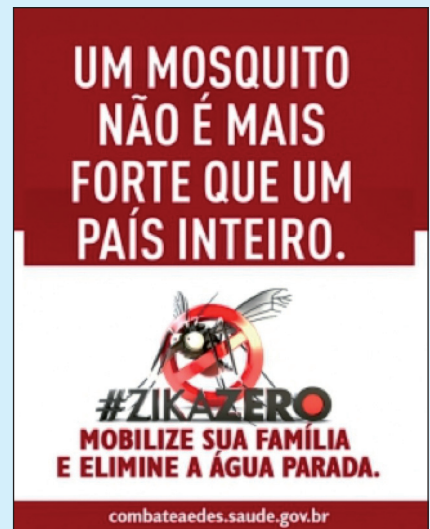
Figura 2. "Una zanzara non può essere più forte di un Paese intero". Manifesto del Governo Brasiliano, 2015.