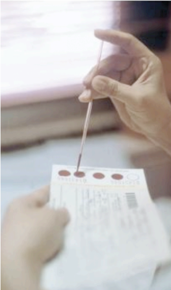
Figura 2. Spot di sangue su carta bibula.